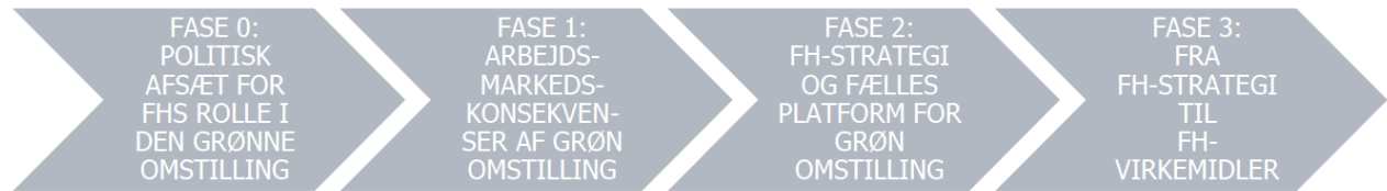
Figur 1. Faser i projektet

FOA er repræsenteret i arbejdsgruppen, der i februar og marts 2020 skal udfolde og konkretisere strategien.