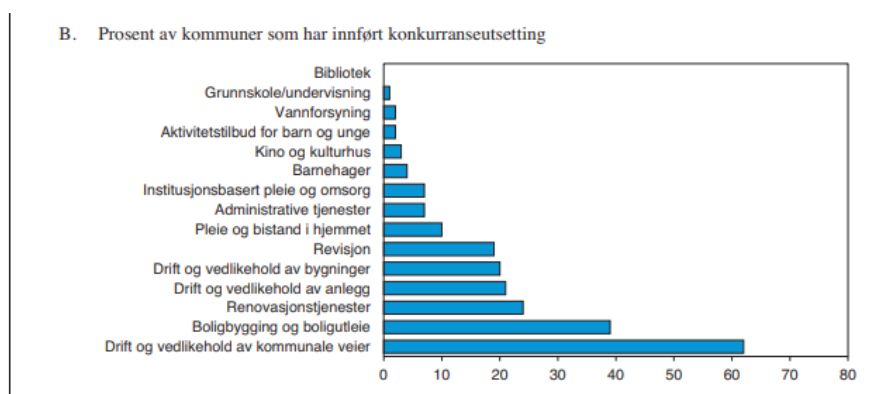
Figur 9.6 Kommuners kjøp fra private og ideelle organisasjoner og konkurranseutsetting. Prosent. 2016

Hvis vi ser på kommunenes bruk av eksterne leverandører får vi dette bilde og fordeling: